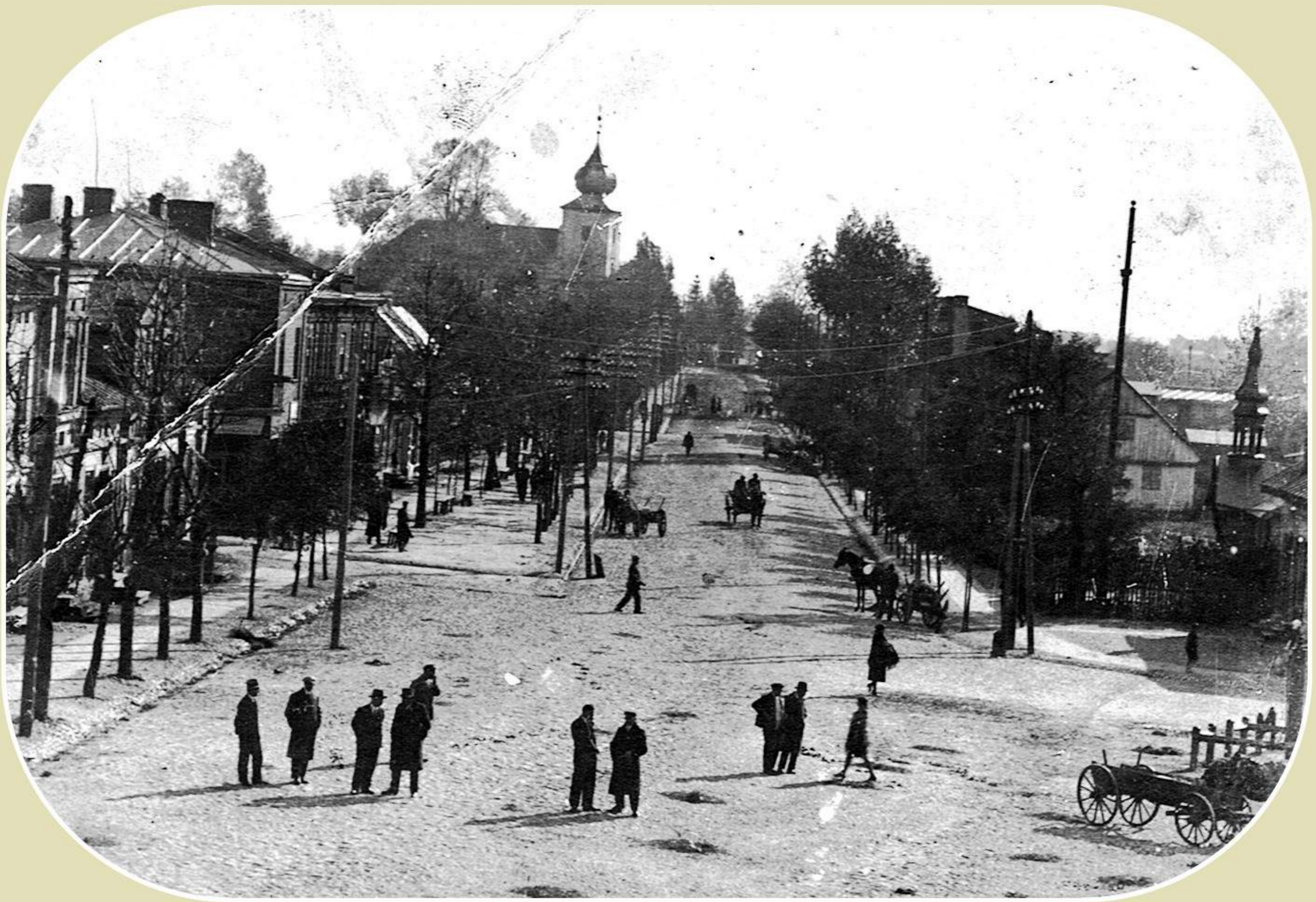
Widok na Rynek i ulicę Sienkiewicza (lata 20. XX wieku)