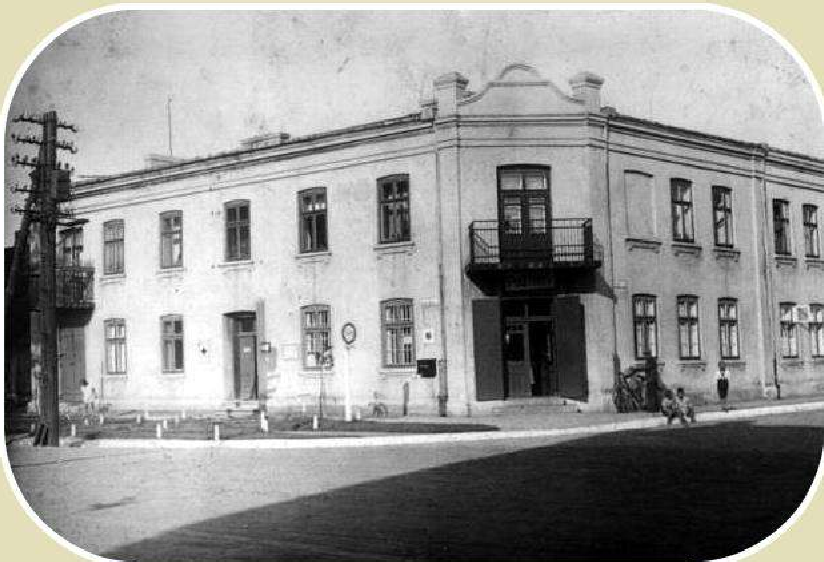
Kamienica przy skrzyżowaniu ulic Sienkiewicza i Wolności (przed wojną mieściły się tam apteka i poczta, lata 20. XX wieku)