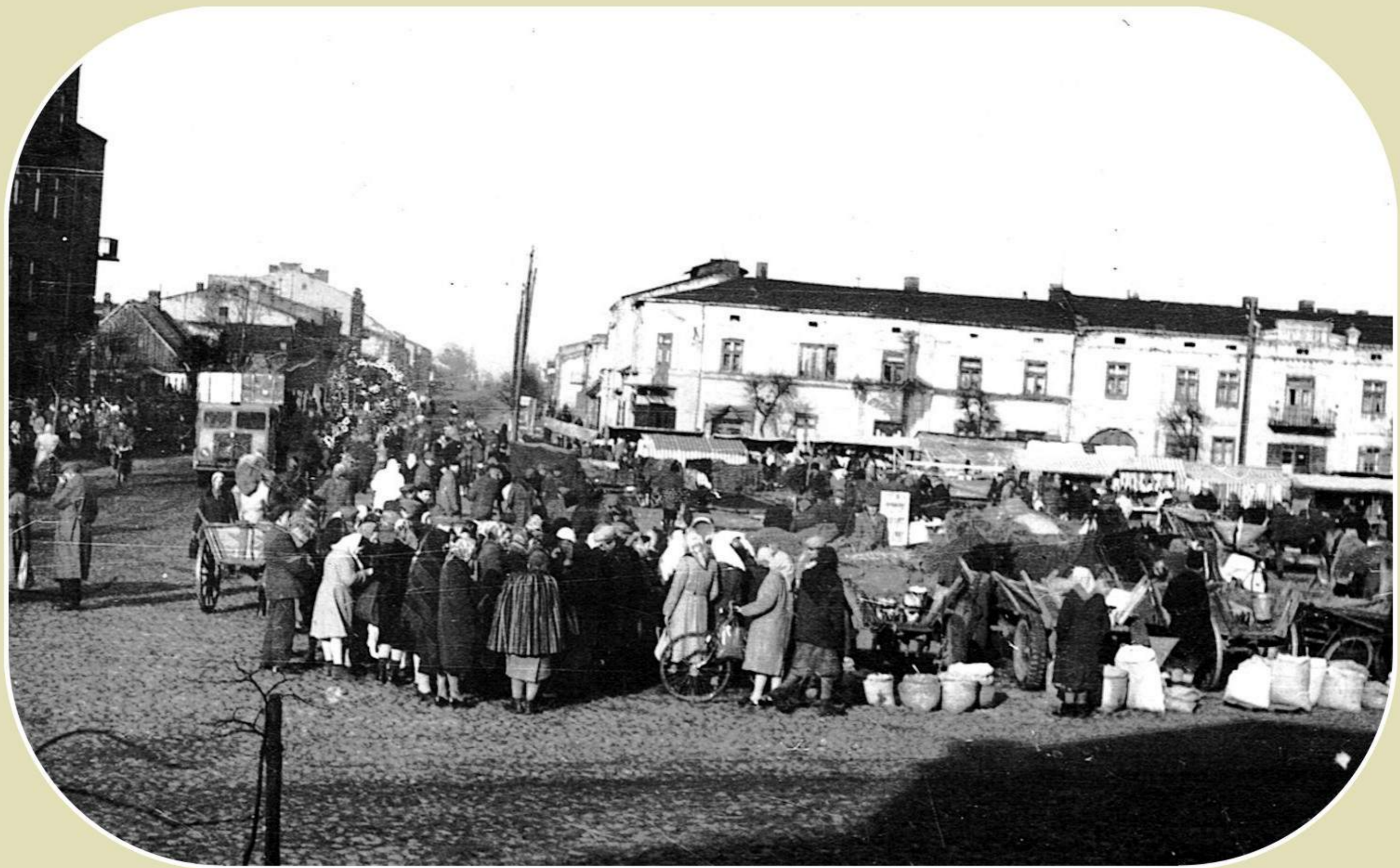
Targ na Rynku w Zelowie (okres międzywojenny)