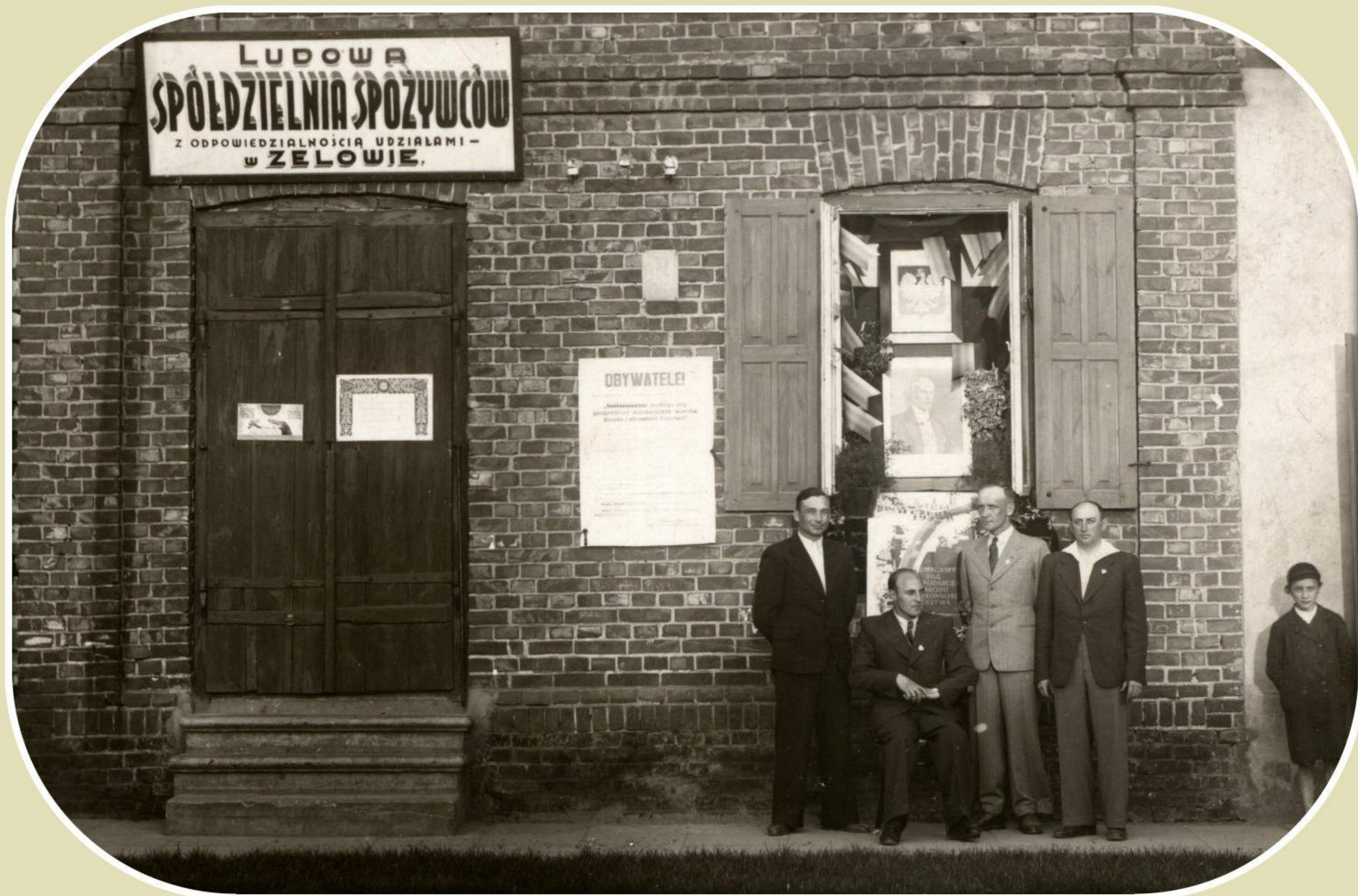
Zarząd Ludowej Spółdzielni Spożywców w Zelowie (rok 1938)