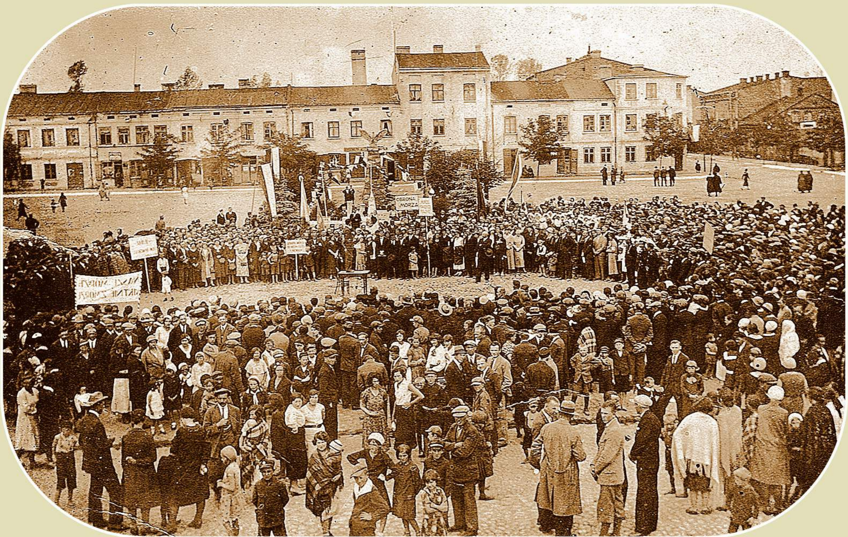
Manifestacja w obronie polskiego dostępu do morza (Rynek w Żelowie, okres międzywojenny)