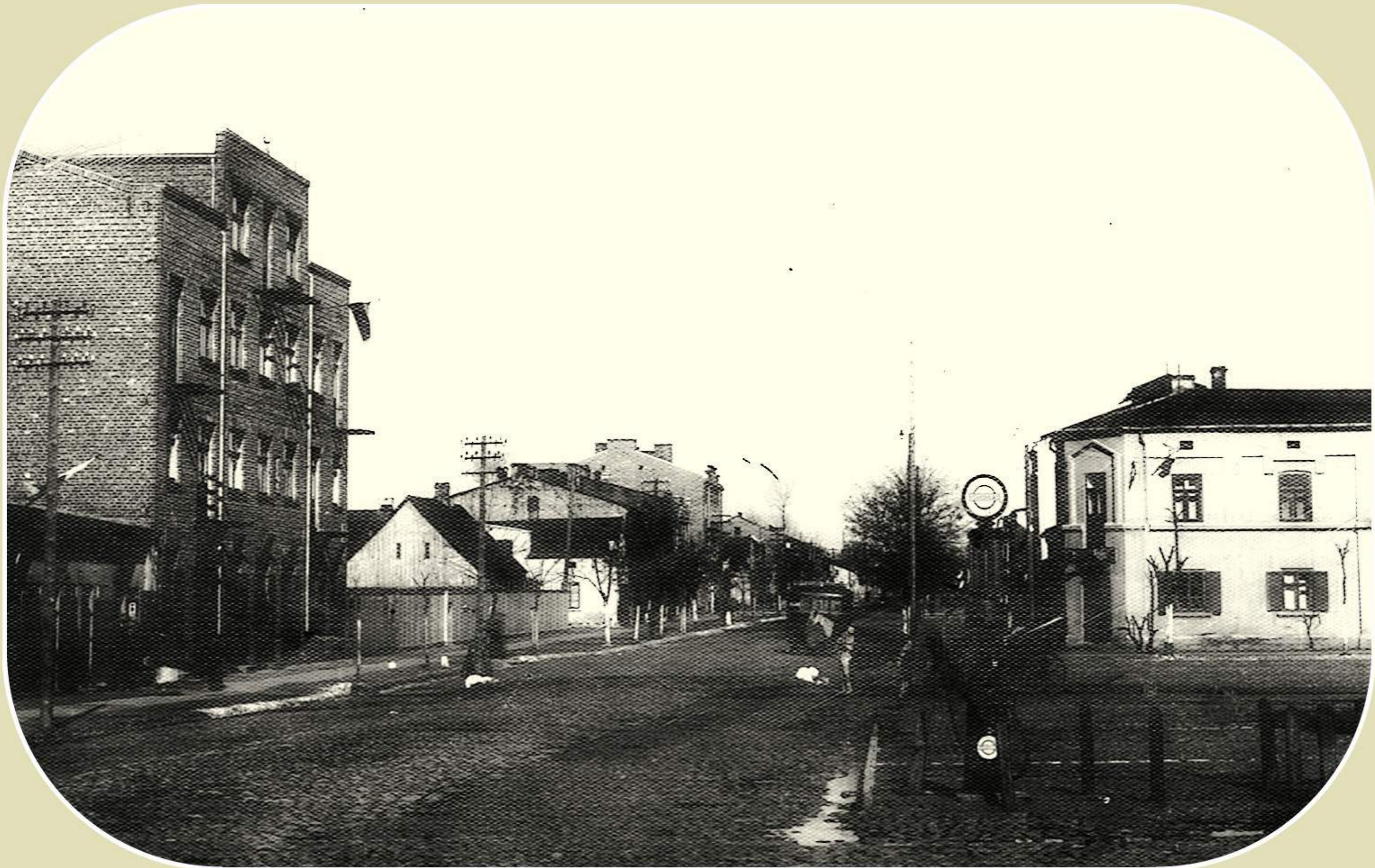
Rynek w Żelazowie (okres międzywojenny)