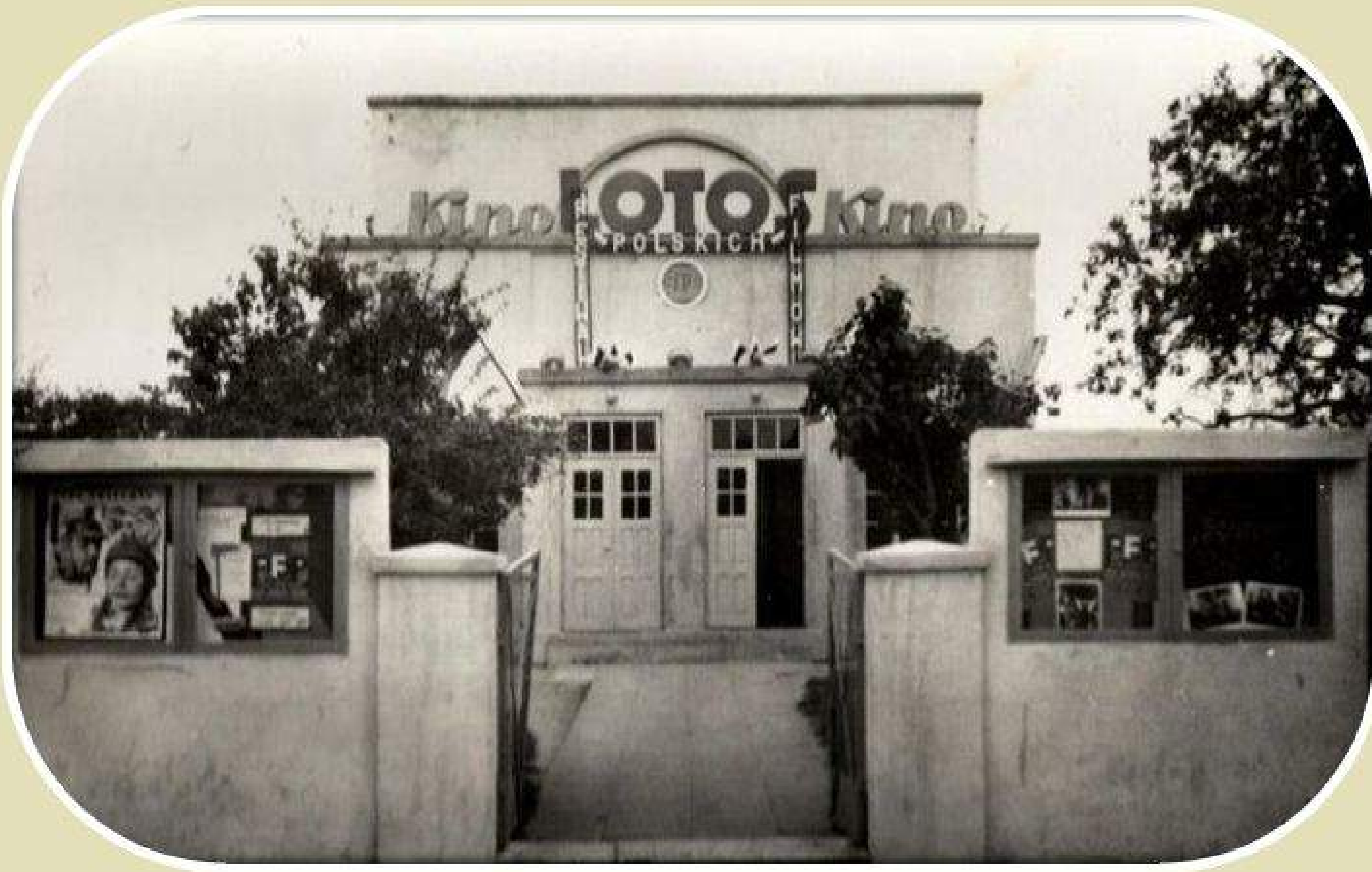
Kino „LOTOS” (okres międzywojenny)