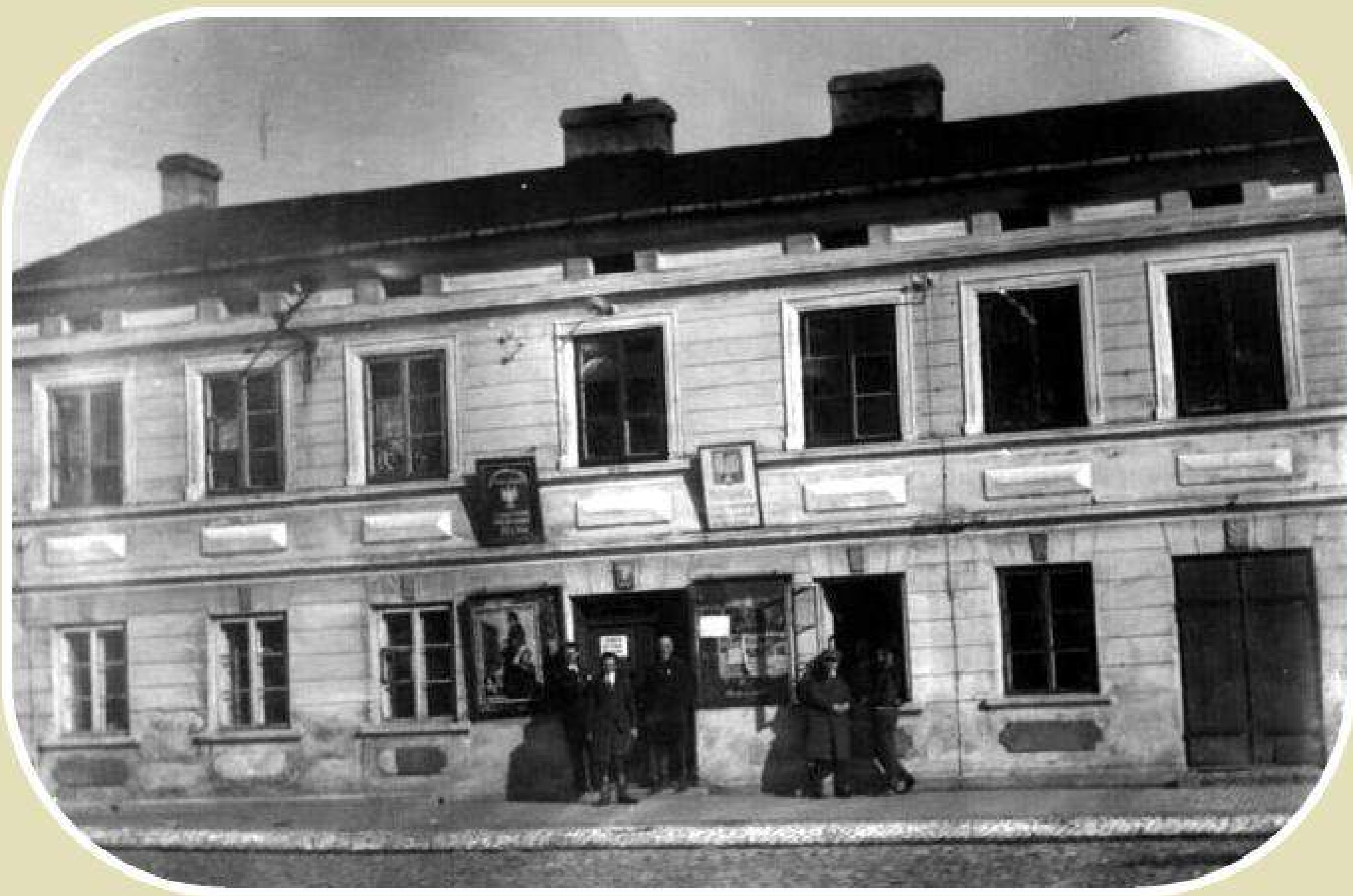
Dawny budynek Urzędu Miejsko-Gminnego w Zelowie na placu Dąbrowskiego (lata 70. XX wieku)