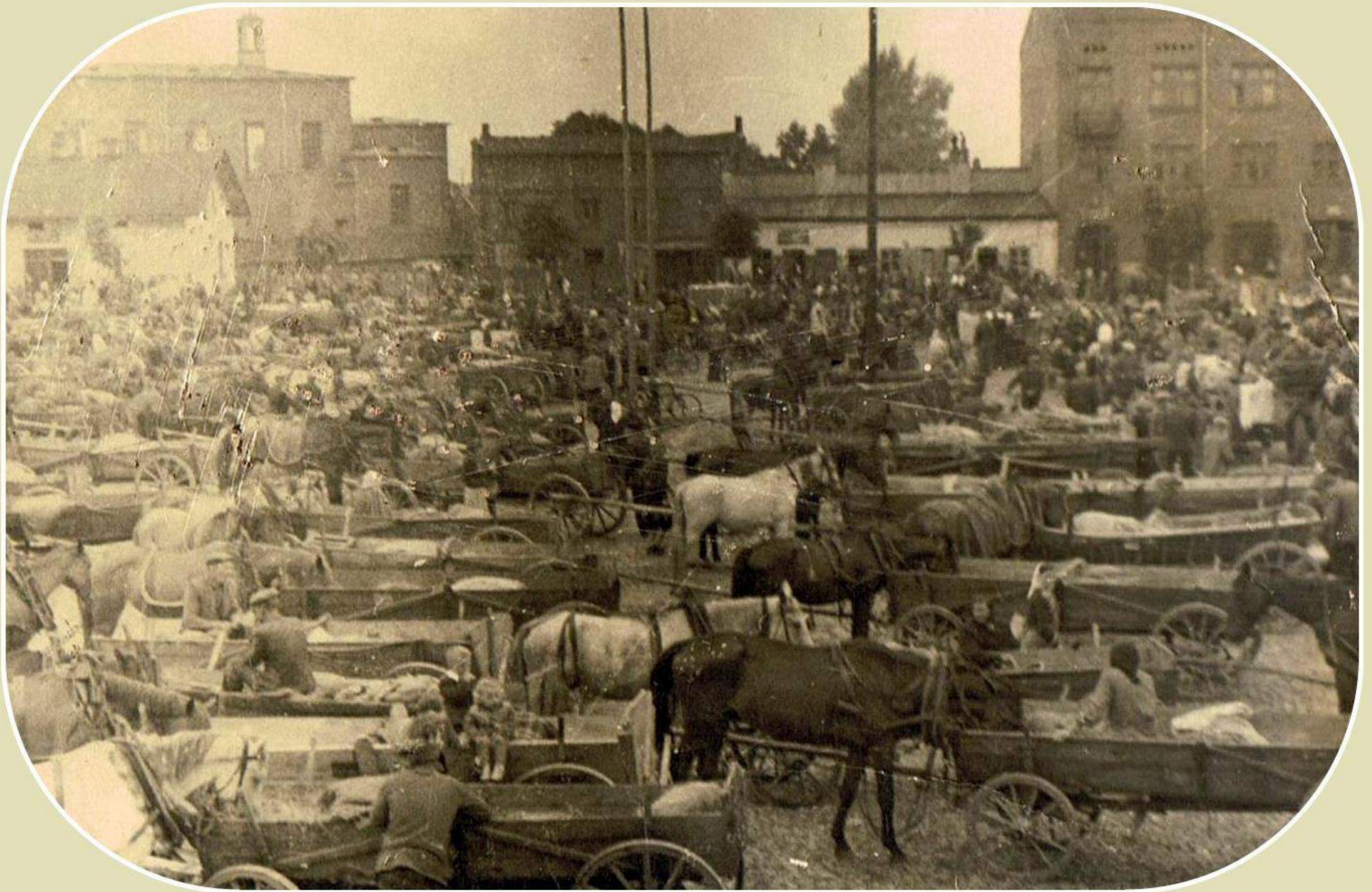
Rynek w Żelazowie (okres międzywojenny)