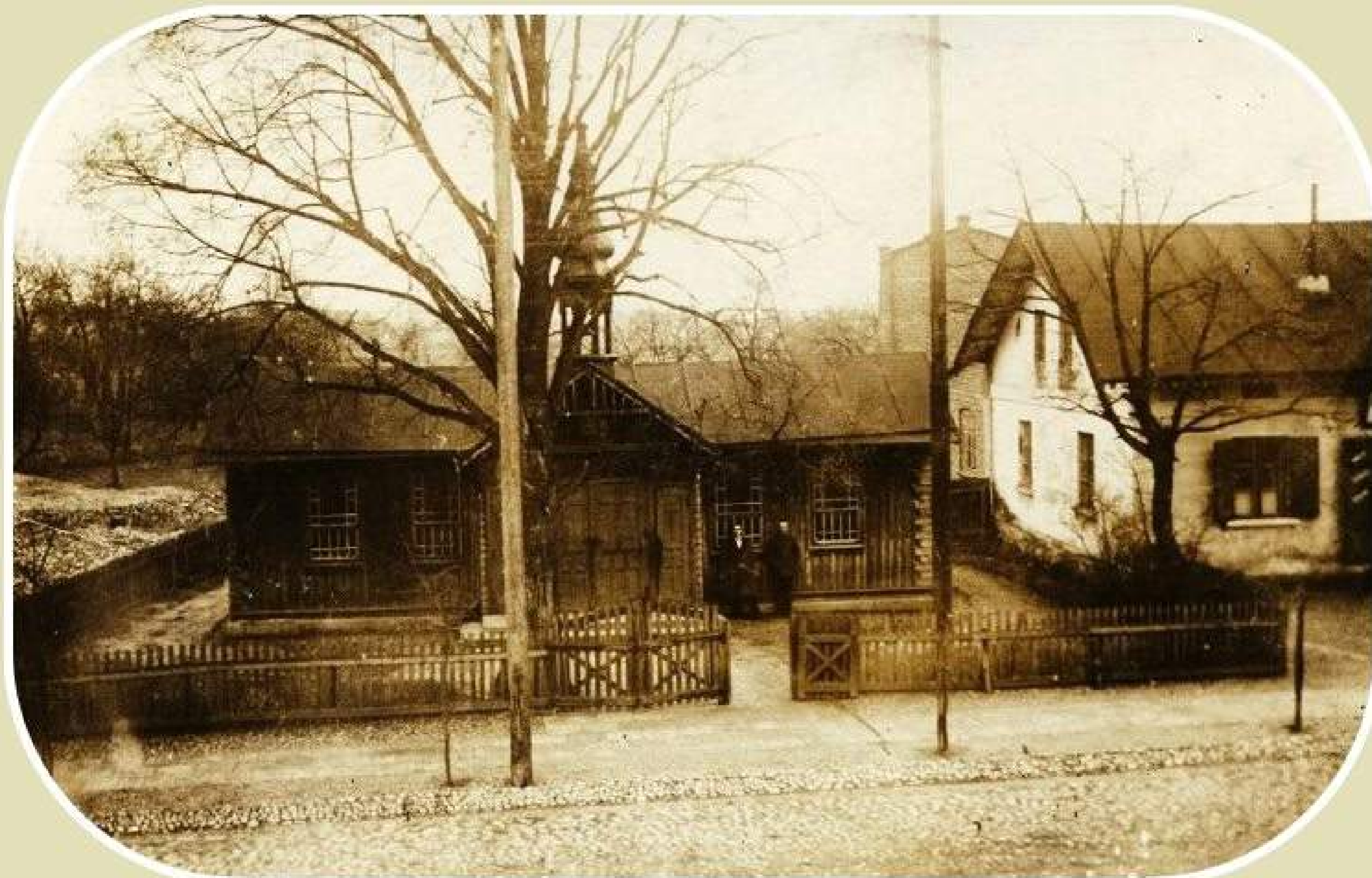
Pierwsza kaplica katolicka w Zelowie (dawny budynek browaru, lata 20. XX wieku)