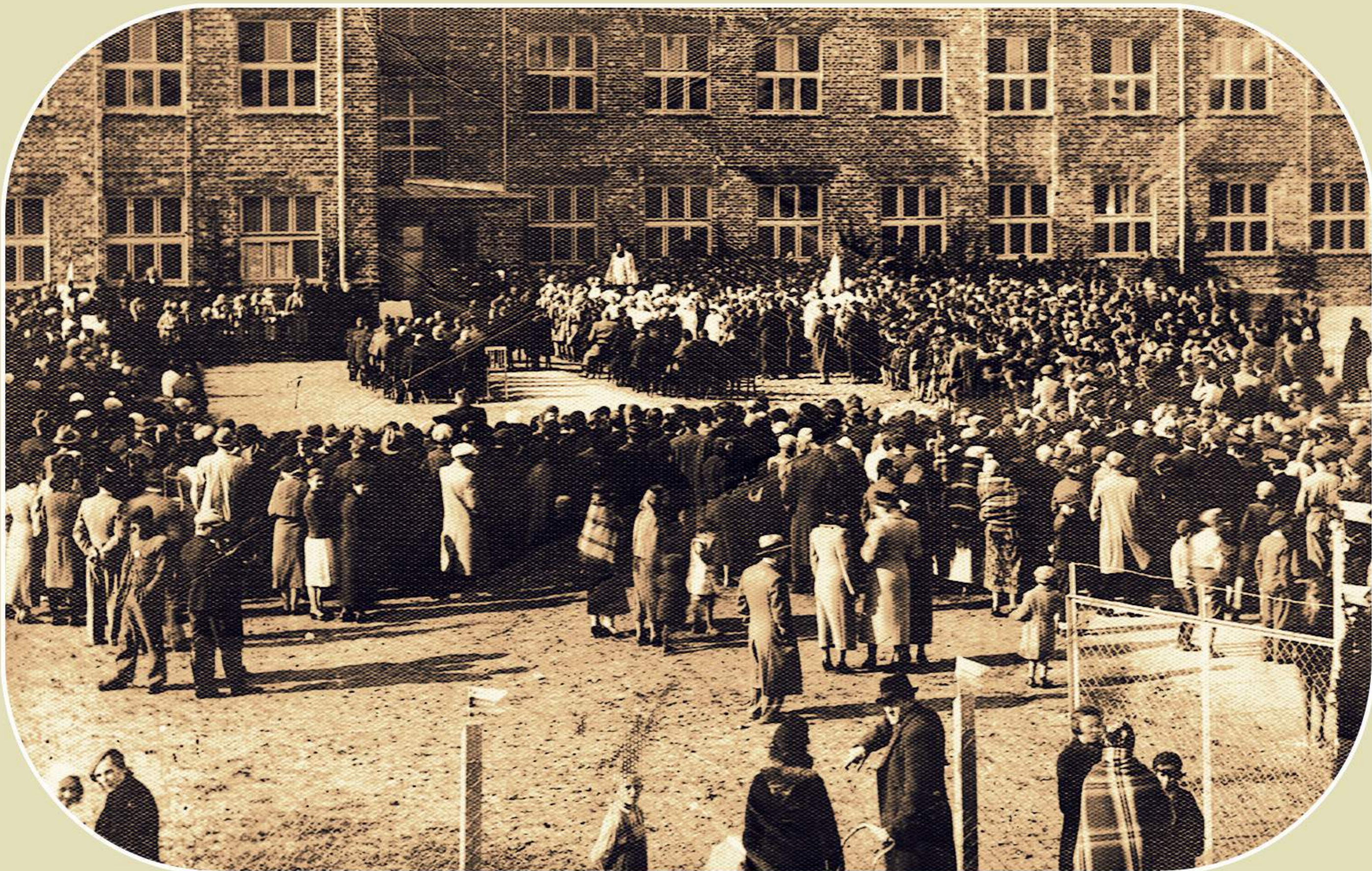
Otwarcie Szkoły Powszechnej w Zelowie (wrzesień 1937 r.)